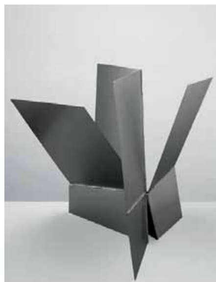
Lygia Clark Monumento a todas las situaciones , 1962 Aluminio, 41 x 66 x 54 cm aprox.