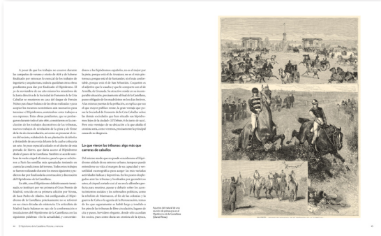
La que vivían los españoles. Algo más que deporte de caballo.

El Hipódromo de la Castellana fue un hito tanto deportivo como urbanístico y social, también el símbolo de una época a punto de desaparecer: la de una aristocracia ociosa que aunó deporte y elegancia.