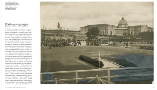
El Hipódromo en su entorno urbano, polígonos, hoteles y edificios públicos.

El primer Concurso de Salto de Obstáculos Internacional de Madrid tuvo lugar el 4 de octubre de 1907. Fue el primer concurso de este tipo que se celebró en España. El concurso se celebró en el Hipódromo de la Castellana y contó con la participación de jinetes de todo el mundo. El concurso fue un éxito y marcó el inicio de una tradición que se prolongó hasta 1932. El concurso se celebró en el Hipódromo de la Castellana y contó con la participación de jinetes de todo el mundo. El concurso fue un éxito y marcó el inicio de una tradición que se prolongó hasta 1932.