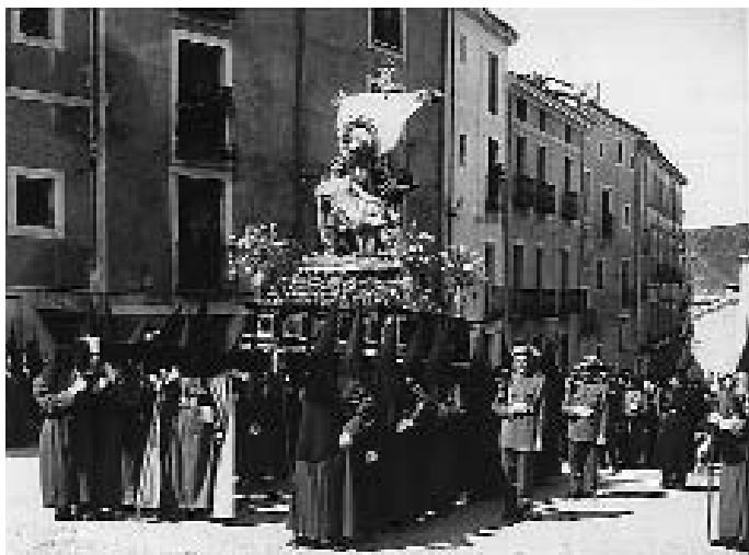
Imágenes de la España different , y sin embargo volcada hacia el turismo: pasos de Semana Santa escoltados por la Guardia Civil, en Cuenca.

españolas se han limitado a impedir simples espectáculos de nudismo, descaradas escenas callejeras e incluso atentados contra los símbolos religiosos y nacionales del país, se ha intentado crear un ambiente hostil a España debajo de cuyo propósito están, pura y simplemente, la enemistad tradicional que nos dispensan ciertas gentes y el ánimo de perjudicar una de las industrias más florecientes de España y el mejor vehículo de entendimiento que tenemos con el extranjero.